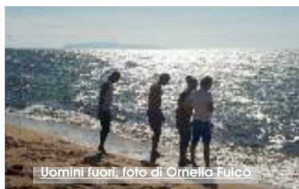
Uomini fuori, foto di Ornella Fulco

La squadra dei San Giuliano's Boys formata da detenuti italiani e stranieri e risultata vincitrice del Campionato OPEN del CSI nonché della speciale classifica "disciplina" ha disputato, grazie ad un permesso speciale concesso dal Magistrato di Sorveglianza, la fase interprovinciale che si è tenuta presso i campetti "Forese" domenica mattina. Non tutti i componenti della squadra hanno potuto usufruire del permesso per problemi giuridici, ma si tratta comunque di un evento che riveste carattere di straordinaria importanza stante la valenza educativa dello sport come momento di confronto, di rispetto delle regole, di dialogo nonché come mezzo di crescita ed integrazione, soprattutto per chi, come i detenuti, si trova in una posizione svantaggiata. Più delle nostre parole vale la forza evocativa delle immagini. La foto che correda questo articolo è stata scattata dalla collega giornalista Ornella Fulco. Alcuni ragazzi della squadra dei San Giuliano's Boys di fronte all'orizzonte: "uomini fuori". Uomini che respirano la libertà del mare, anche se per poche ore. (R.T.)