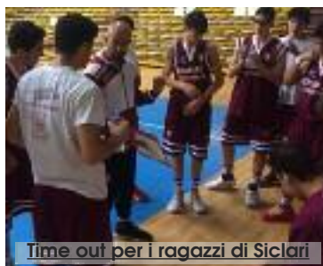
Time out per i ragazzi di Siclari

Una gara in salita per i giovani atleti trapanesi, che hanno trovato il primo vantaggio sola-