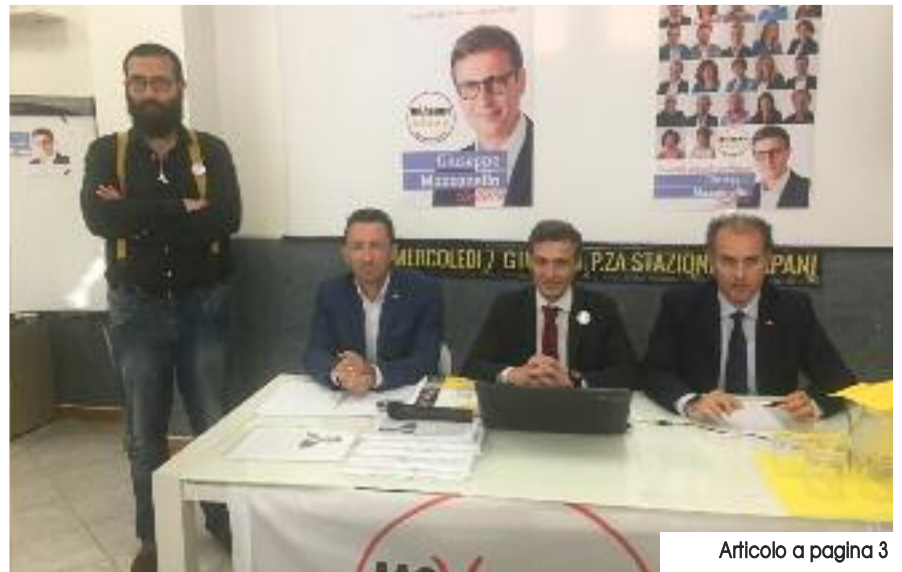
Articolo a pagina 3